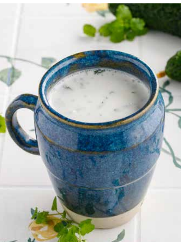
АЙРАН ОТ НАНИ 350₽ Nani's ayran | 纳尼太太的酸奶