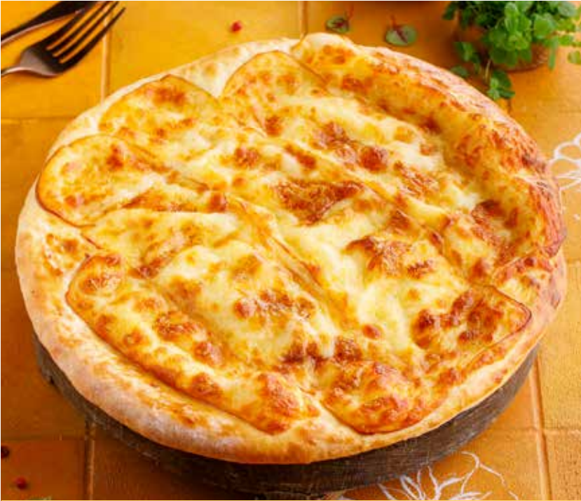
ХАЧАПУРИ С КОПЧЕНЫМ СЫРОМ 790Р Smoked cheese khachapuri | 烟熏奶酪卡查普里