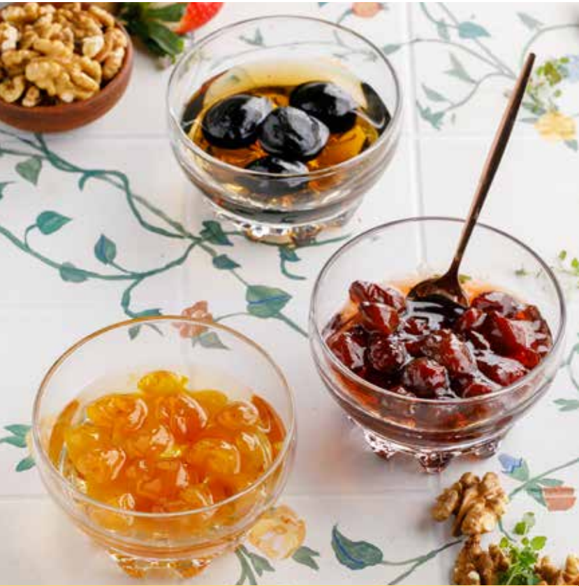
ВАРЕНЬЕ в ассортименте 450 Р Assorted jams | 什锦果酱