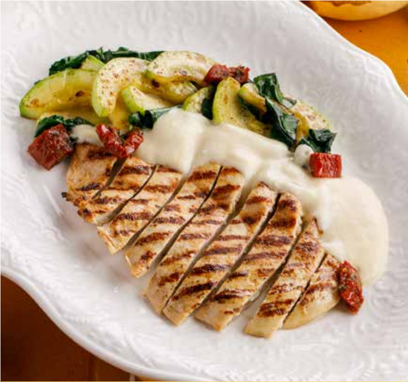
КУРИНАЯ ГРУДКА С КАБАЧКАМИ И СОУСОМ «4 СЫРА»