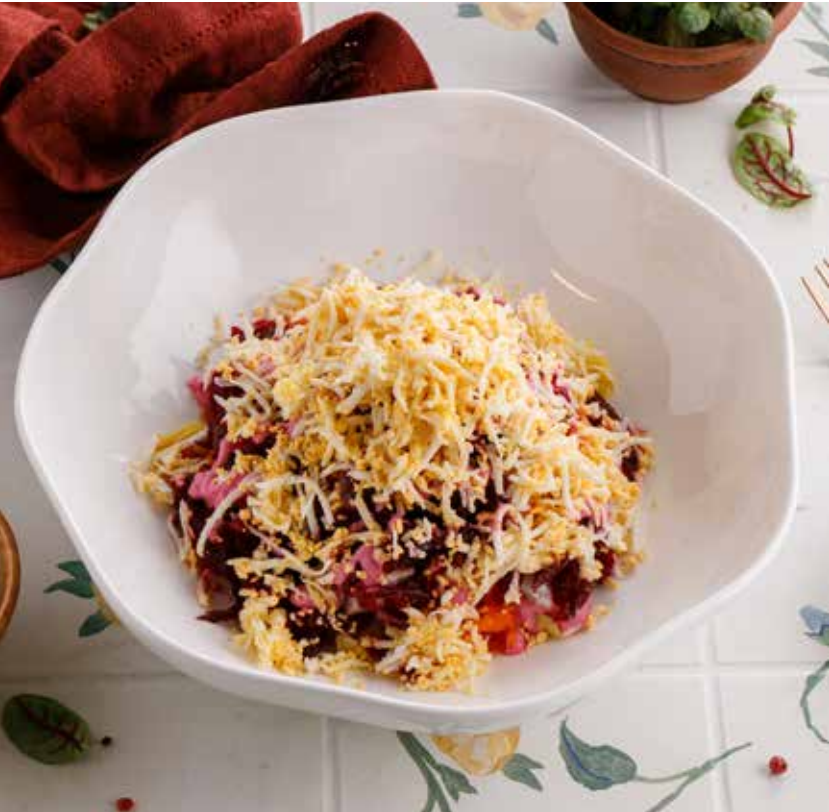
СЕЛЬДЬ ПОД ШУБОЙ 550 Р Dressed herring | 俄罗斯传统红菜鲱鱼沙拉