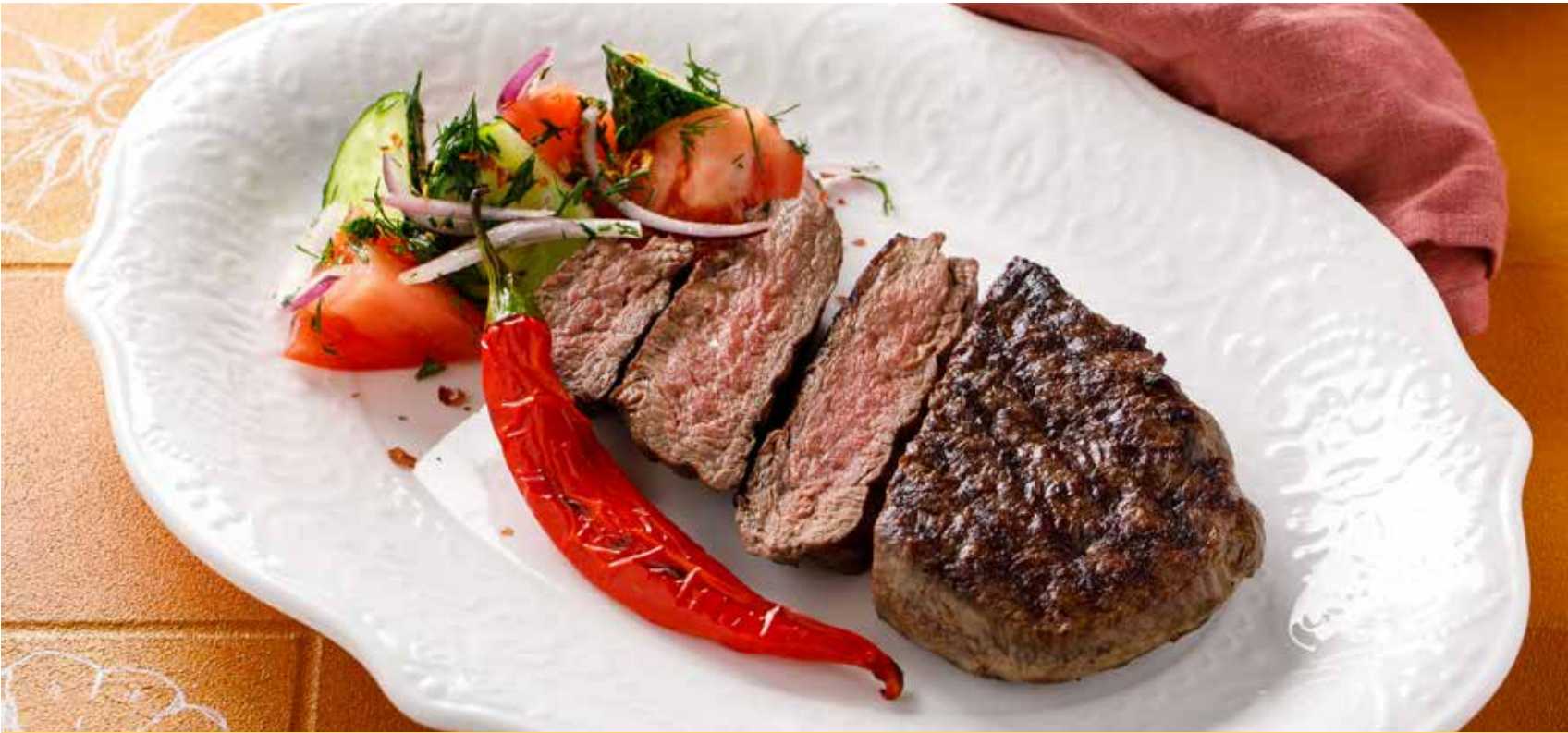
ВЫРЕЗКА ТЕЛЯТИНЫ 1690Р Veal sirloin | 小牛里脊肉

ПОЖАЛУЙСТА, СООБЩИТЕ ОФИЦИАНТУ, ЕСЛИ У ВАС ЕСТЬ АЛЛЕРГИЯ НА КАКИЕ-ЛИБО ПРОДУКТЫ | PLEASE, TELL YOUR WAITER IF YOU HAVE ANY FOOD ALLERGY | 如果您对某些饮食会过敏, 请通知您的服务员。