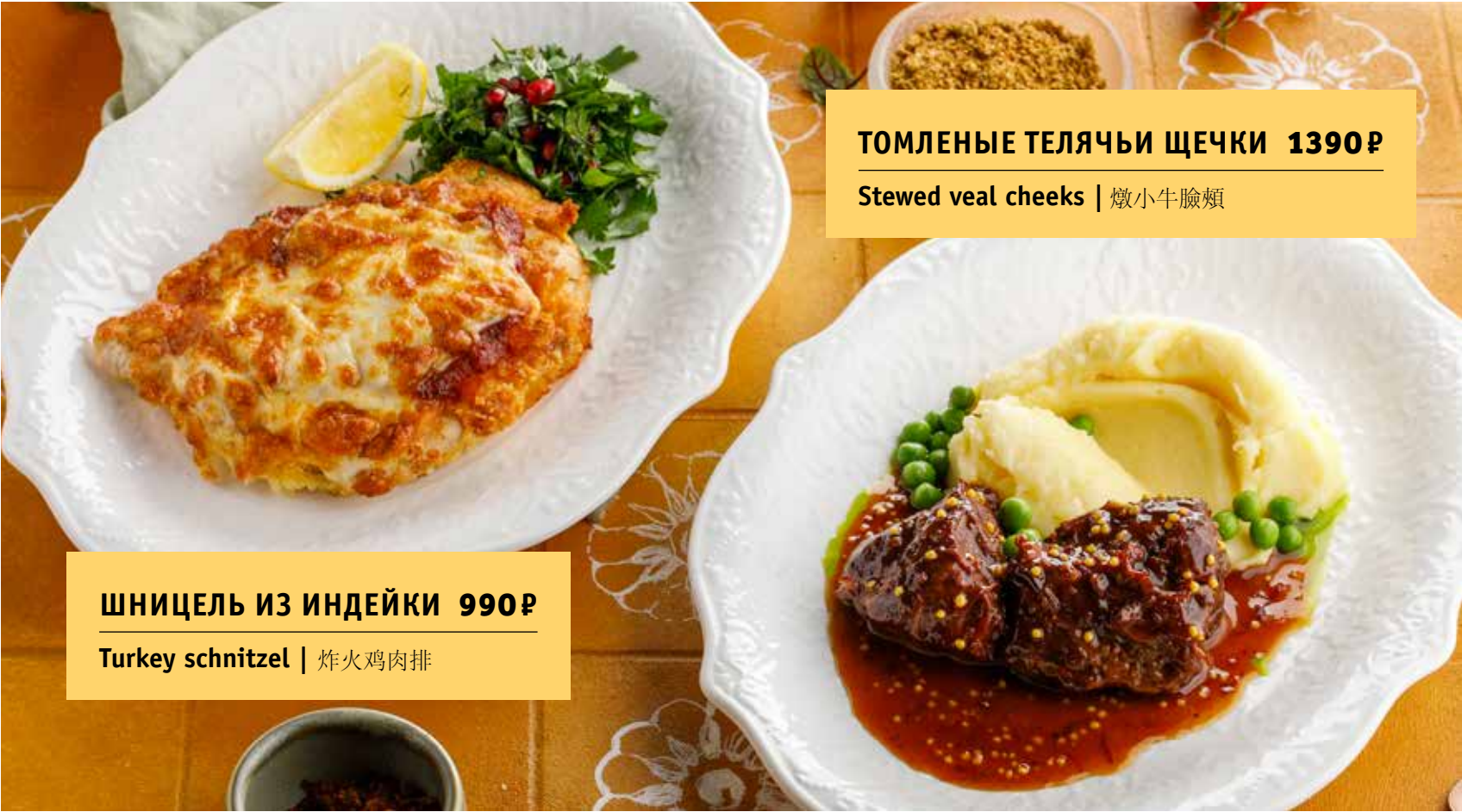
ТОМЛЕННЫЕ ТЕЛЯЧЬИ ЩЕЧКИ 1390₽