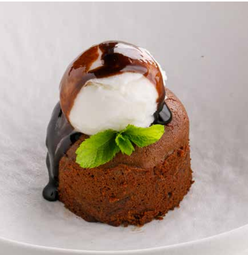
ШОКОЛАДНАЯ ШКАТУЛКА 650 Р Chocolate box | 巧克力锦匣蛋糕