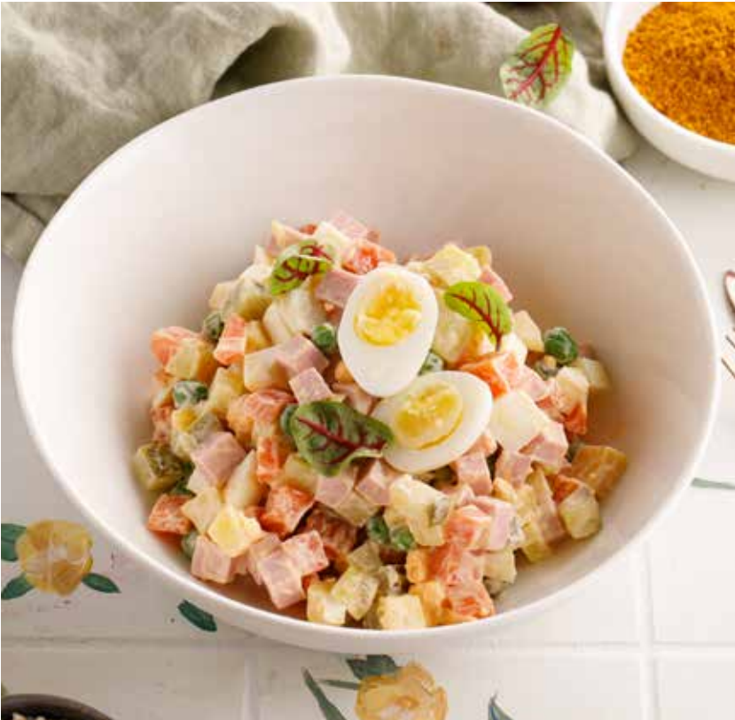
ОЛИВЬЕ 550 Р Olivier Russian salad | 奧利維爾俄羅斯沙拉