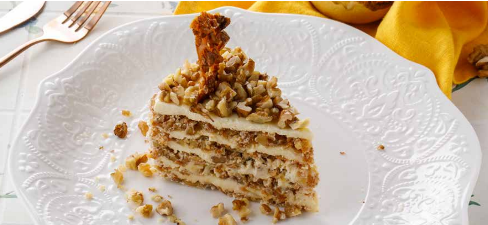
ТОРТ ГРЕЦКИЙ ОРЕХ 650 Р Walnut cake | 核桃糕