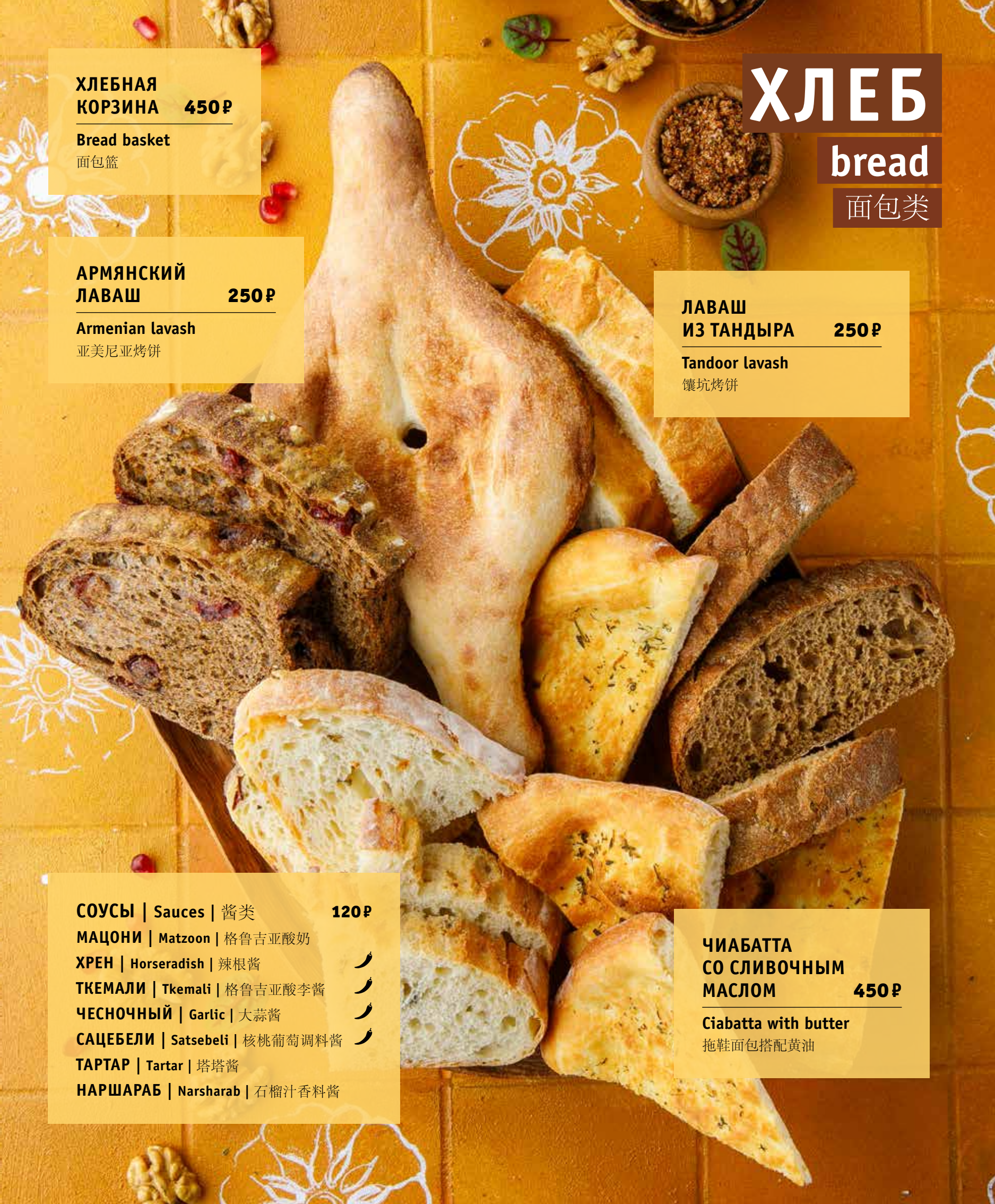
ХЛЕБНАЯ КОРЗИНА Bread basket 面包篮 450₽

ПОЖАЛУЙСТА, СООБЩИТЕ ОФИЦИАНТУ, ЕСЛИ У ВАС ЕСТЬ АЛЛЕРГИЯ НА КАКИЕ-ЛИБО ПРОДУКТЫ | PLEASE, TELL YOUR WAITER IF YOU HAVE ANY FOOD ALLERGY | 如果您对某些饮食会过敏，请通知您的服务员。