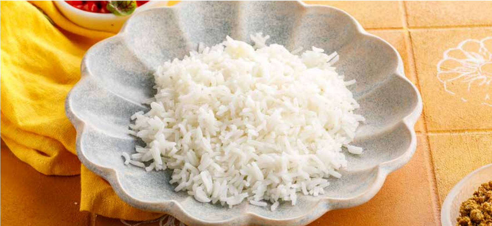
РИС БАСМАТИ Basmati rice | 印度香米 290₽