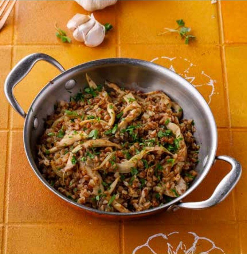
ГРЕЧА С ГРИБАМИ Buckwheat with mushrooms | 蘑菇荞麦饭 390₽

ПОЖАЛУЙСТА, СООБЩИТЕ ОФИЦИАНТУ, ЕСЛИ У ВАС ЕСТЬ АЛЛЕРГИЯ НА КАКИЕ-ЛИБО ПРОДУКТЫ | PLEASE, TELL YOUR WAITER IF YOU HAVE ANY FOOD ALLERGY | 如果您对某些饮食会过敏，请通知您的服务员。