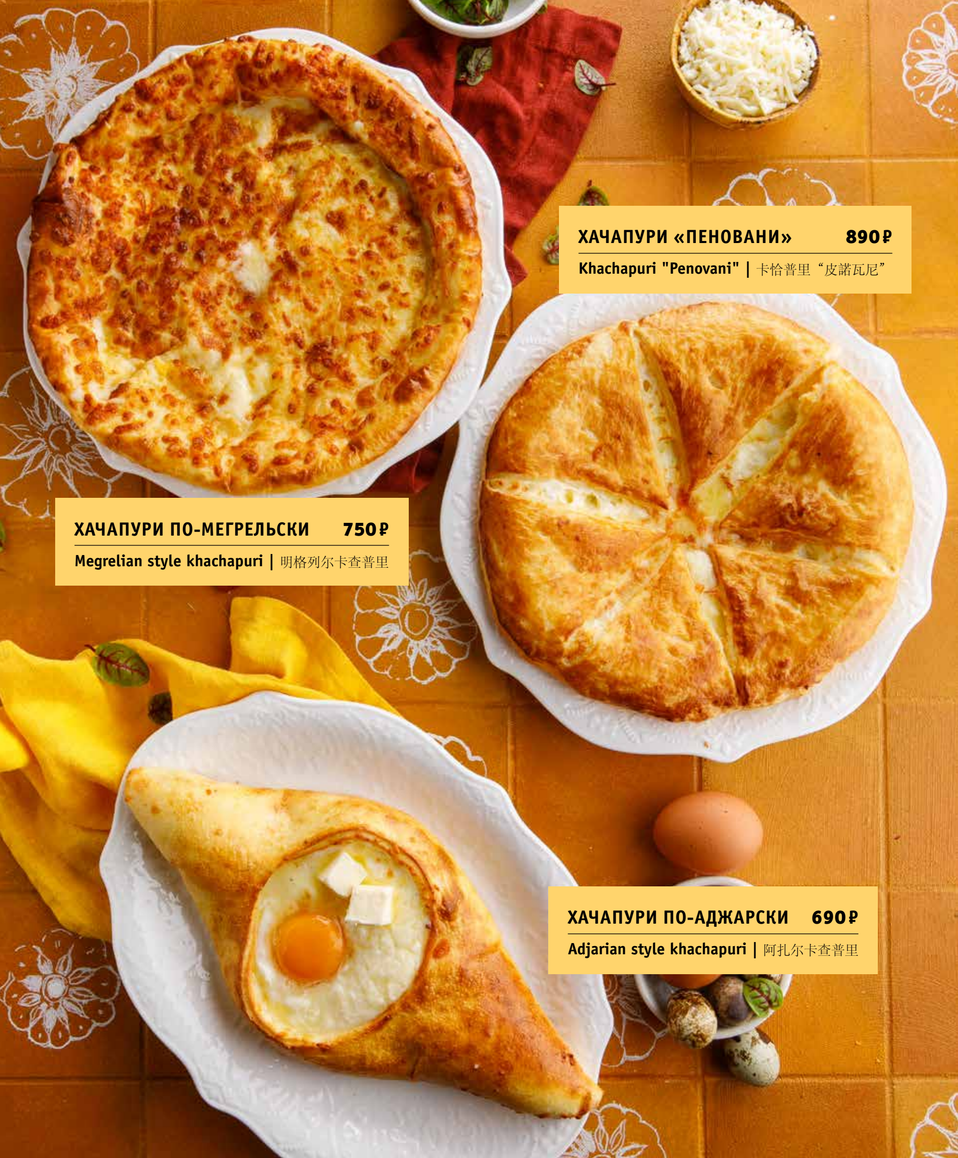
ХАЧАПУРИ «ПЕНОВАНИ» 890Р Khachapuri "Penovani" | 卡恰普里“皮諾瓦尼”