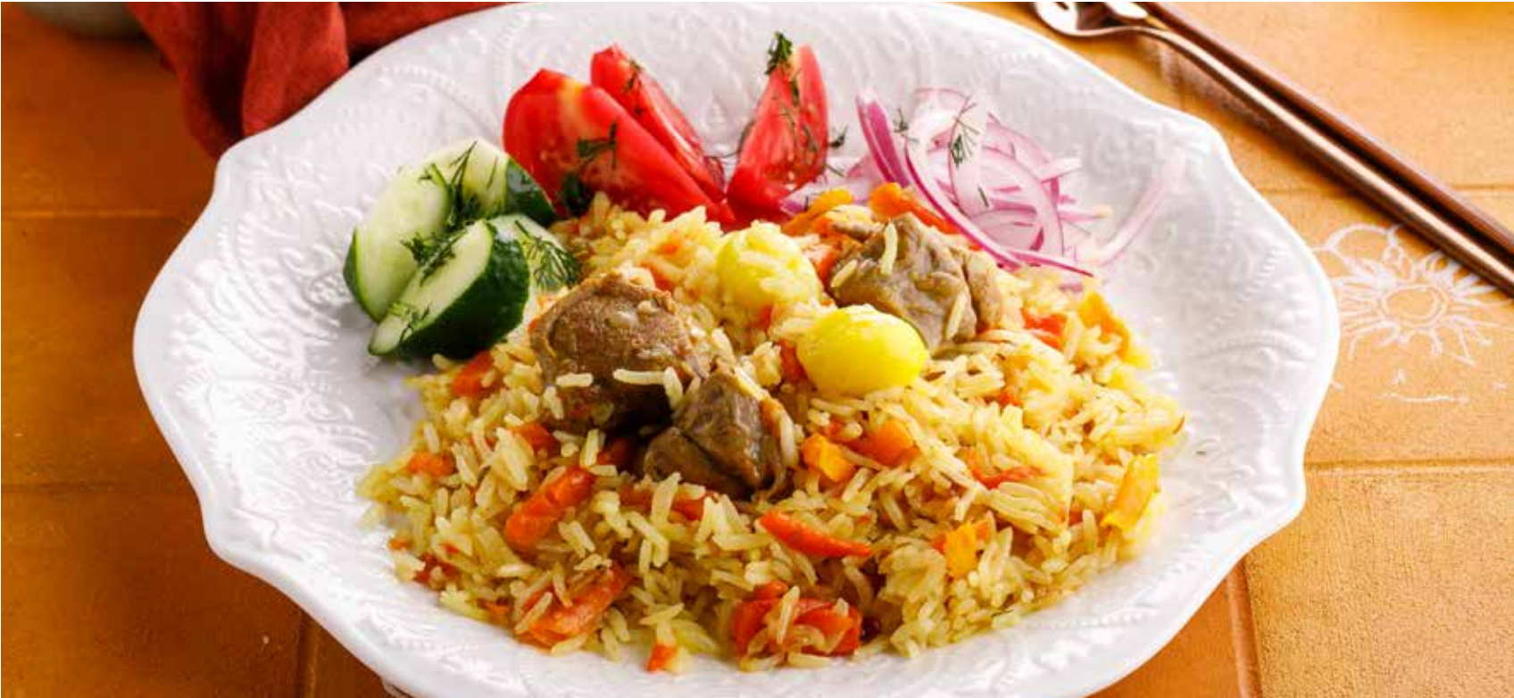
ПЛОВ С БАРАНИНОЙ