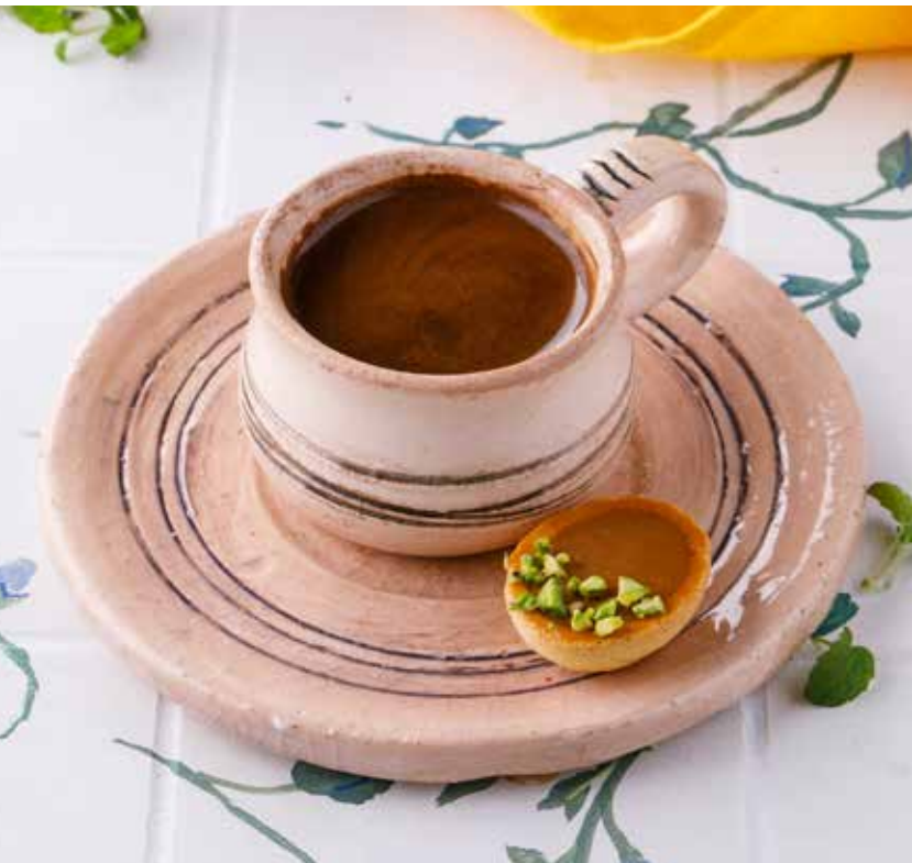
КОФЕ ПО-СУХУМСКИ 350 Р Sukhumi style coffee | 苏呼米咖啡