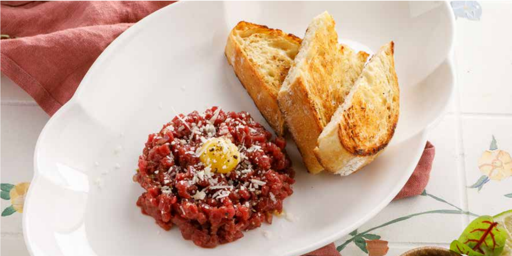
ТАРТАР ИЗ ГОВЯДИНЫ1090 Р Beef tartare | 牛肉塔塔