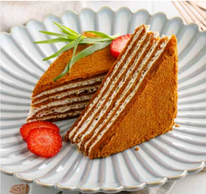
МЕДОВИК 590 Р Medovik (Honey cake) | 蜂蜜蛋糕