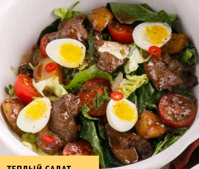
ТЕПЛЫЙ САЛАТ С КУРИНОЙ ПЕЧЕНЬЮ 690 Р Warm salad with chicken liver 鸡肝热沙拉