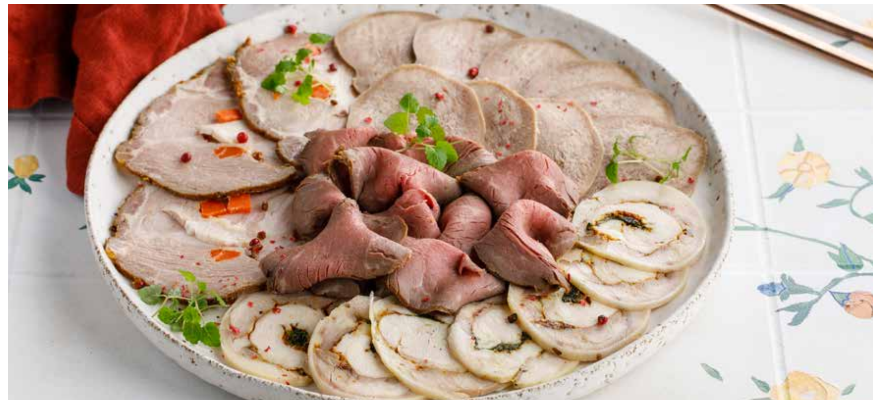
МЯСНОЕ АССОРТИ 2190₽ Meat platter | 肉类大盘

ПОЖАЛУЙСТА, СООБЩИТЕ ОФИЦИАНТУ, ЕСЛИ У ВАС ЕСТЬ АЛЛЕРГИЯ НА КАКИЕ-ЛИБО ПРОДУКТЫ | PLEASE, TELL YOUR WAITER IF YOU HAVE ANY FOOD ALLERGY | 如果您对某些饮食会过敏, 请通知您的服务员。