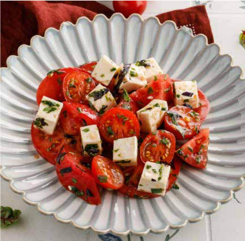
ИМЕРЕТИНСКИЙ САЛАТ 750 Р Imeretian salad | 伊梅列季沙拉