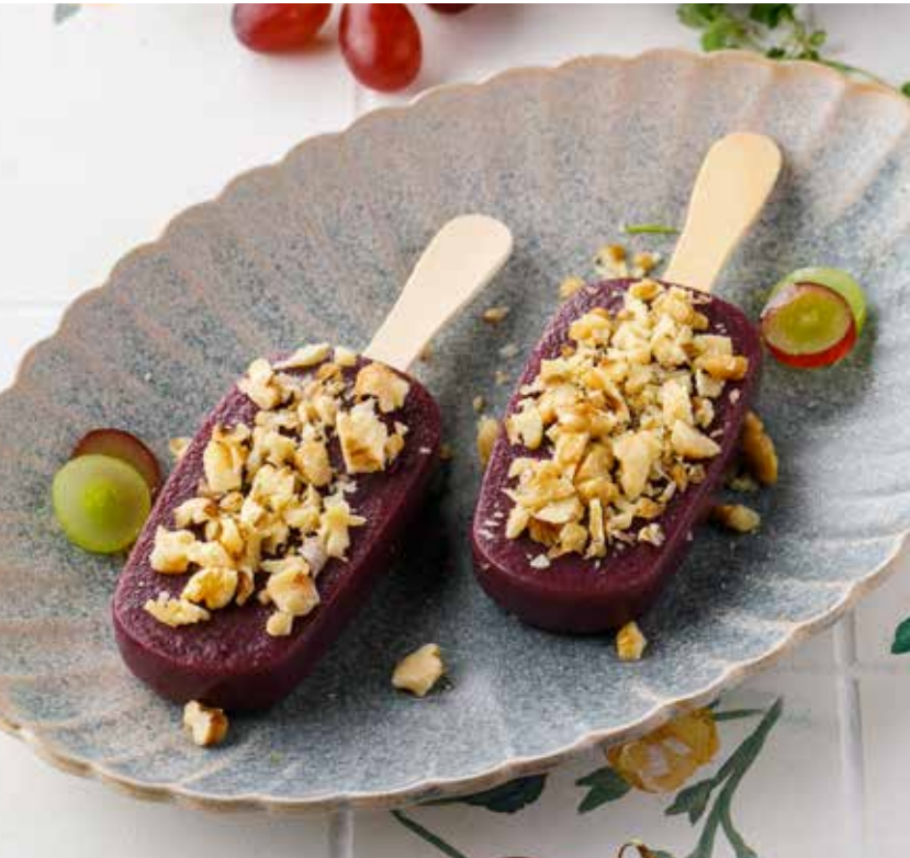
ПЕЛАМУШИ 450 Р Pelamushi | 葡萄果冻