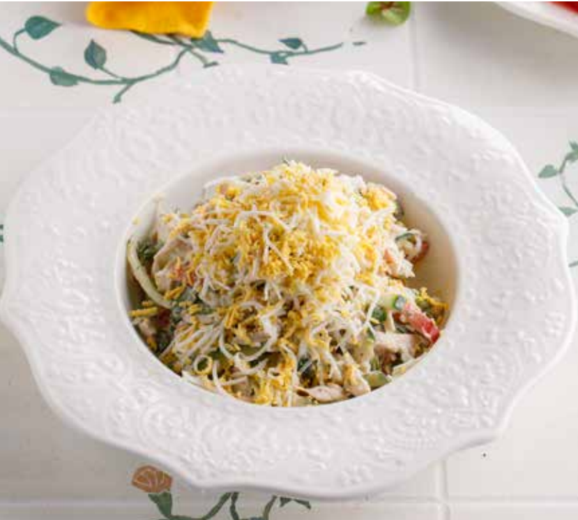
САЛАТ С КУРИНОЙ ГРУДКОЙ И ОВОЩАМИ 590 Р Salad with chicken breast and vegetables 鸡胸肉蔬菜沙拉