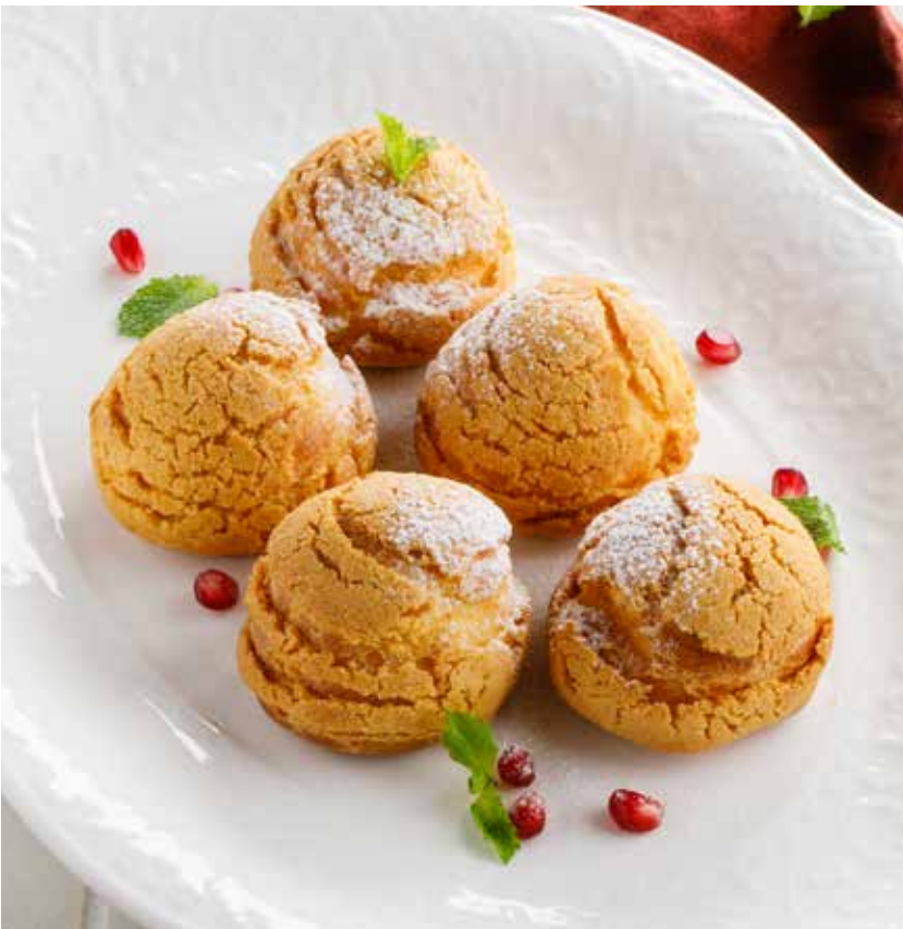
ЗАВАРНЫЕ БУЛОЧКИ 490 Р Choux buns | 臭包子