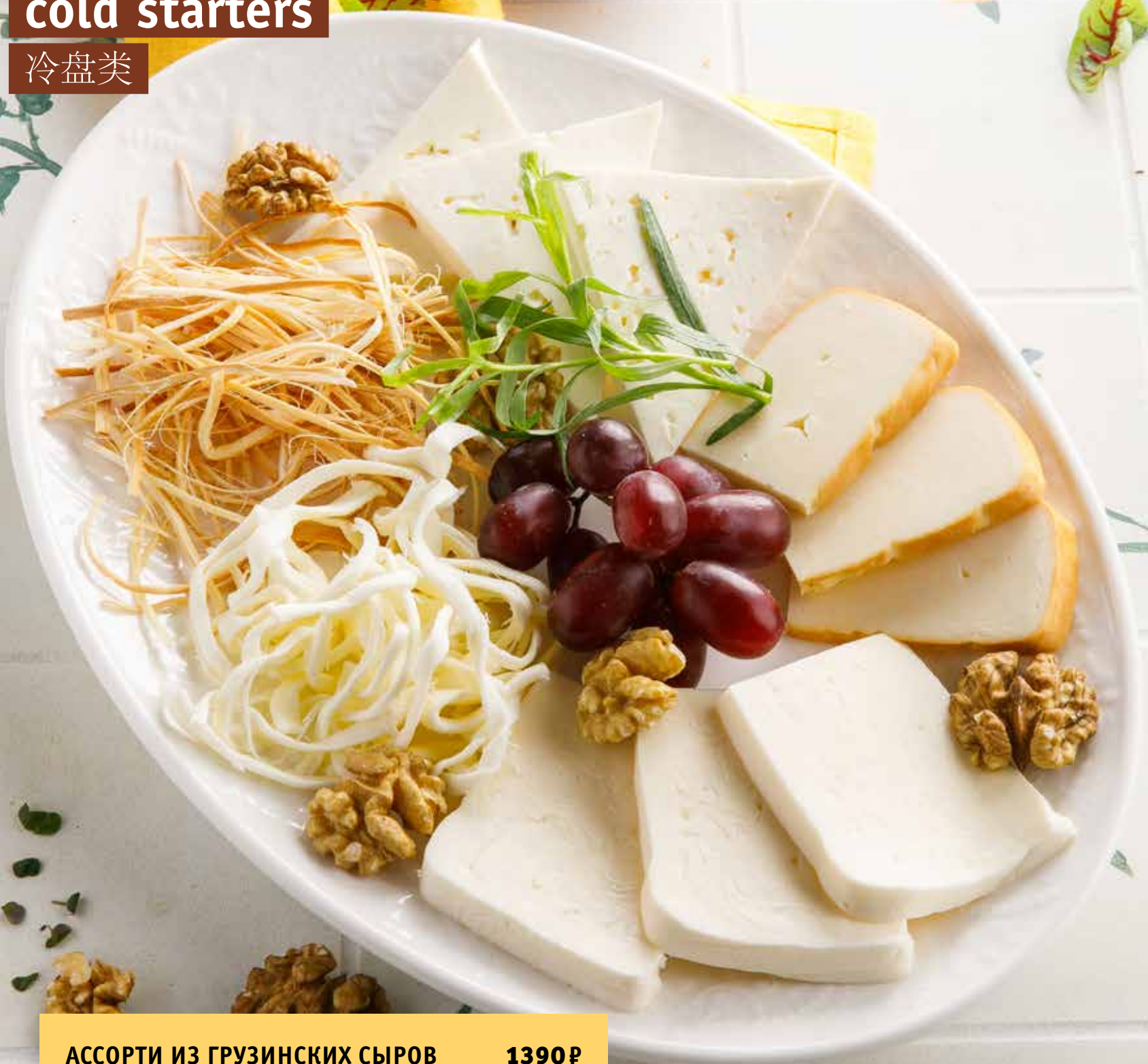
АССОРТИ ИЗ ГРУЗИНСКИХ СЫРОВ 1390₽ Assorted of Georgian cheese | 什锦格鲁吉亚奶酪