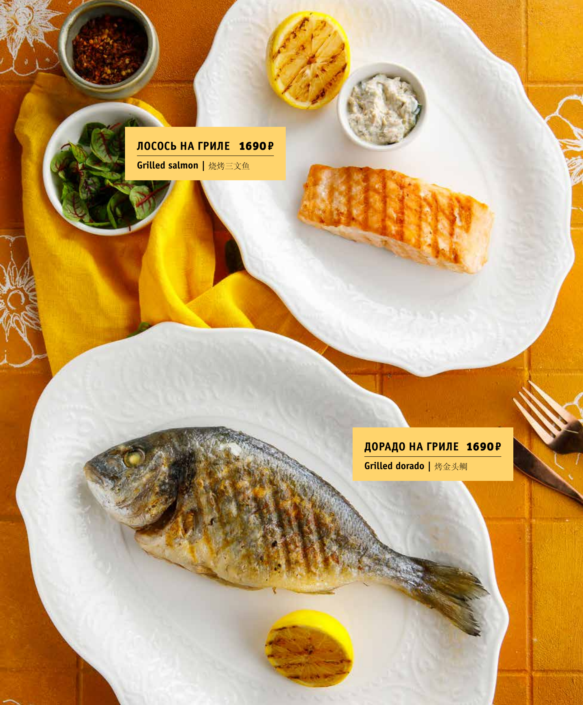
ЛОСОСЬ НА ГРИЛЕ 1690Р Grilled salmon | 烧烤三文鱼

ПОЖАЛУЙСТА, СООБЩИТЕ ОФИЦИАНТУ, ЕСЛИ У ВАС ЕСТЬ АЛЛЕРГИЯ НА КАКИЕ-ЛИБО ПРОДУКТЫ | PLEASE, TELL YOUR WAITER IF YOU HAVE ANY FOOD ALLERGY | 如果您对某些饮食会过敏, 请通知您的服务员。