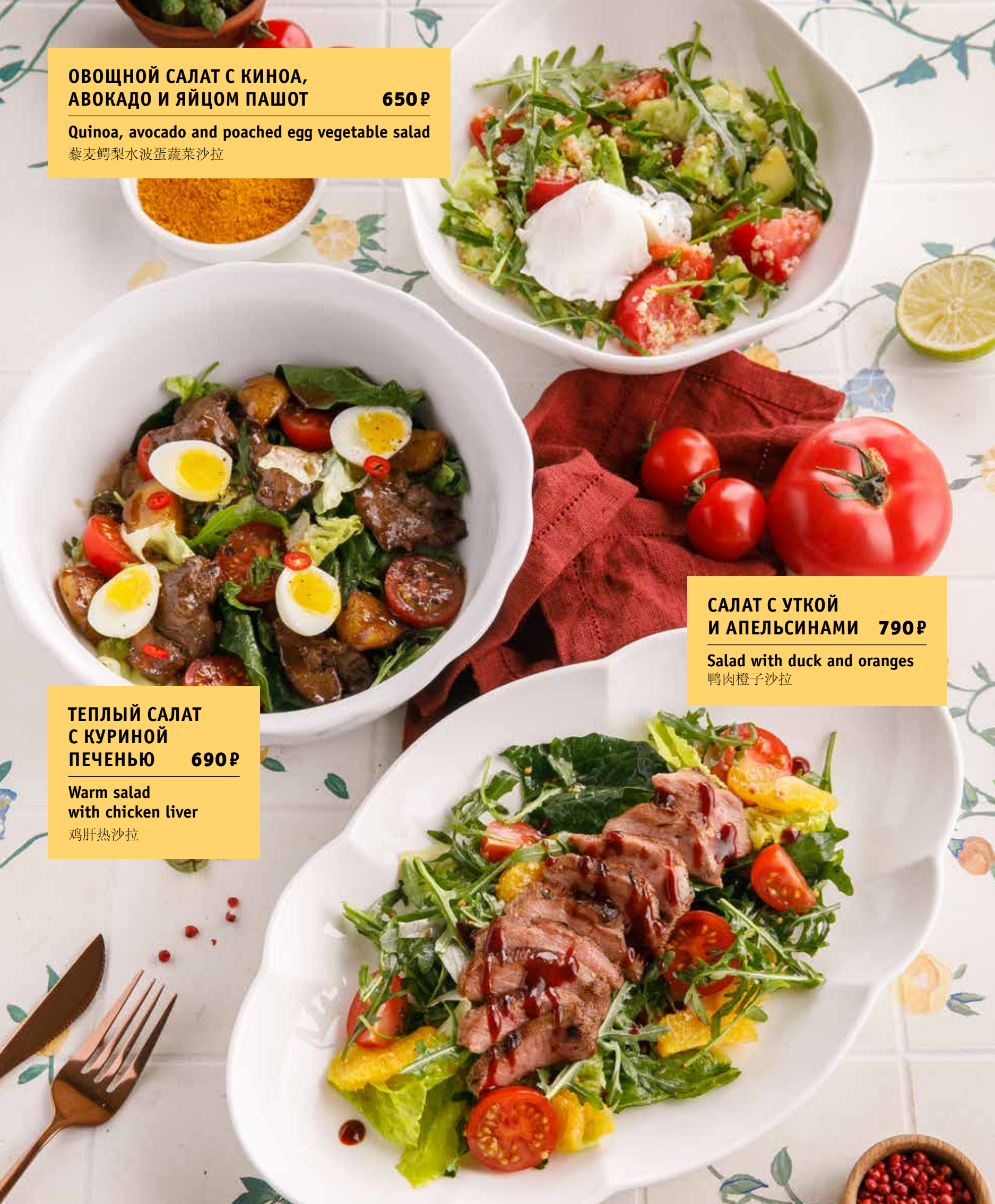
ОВОЩНОЙ САЛАТ С КИНОА, АВОКАДО И ЯЙЦОМ ПАШОТ 650 Р Quinoa, avocado and poached egg vegetable salad 藜麦鳄梨水波蛋蔬菜沙拉