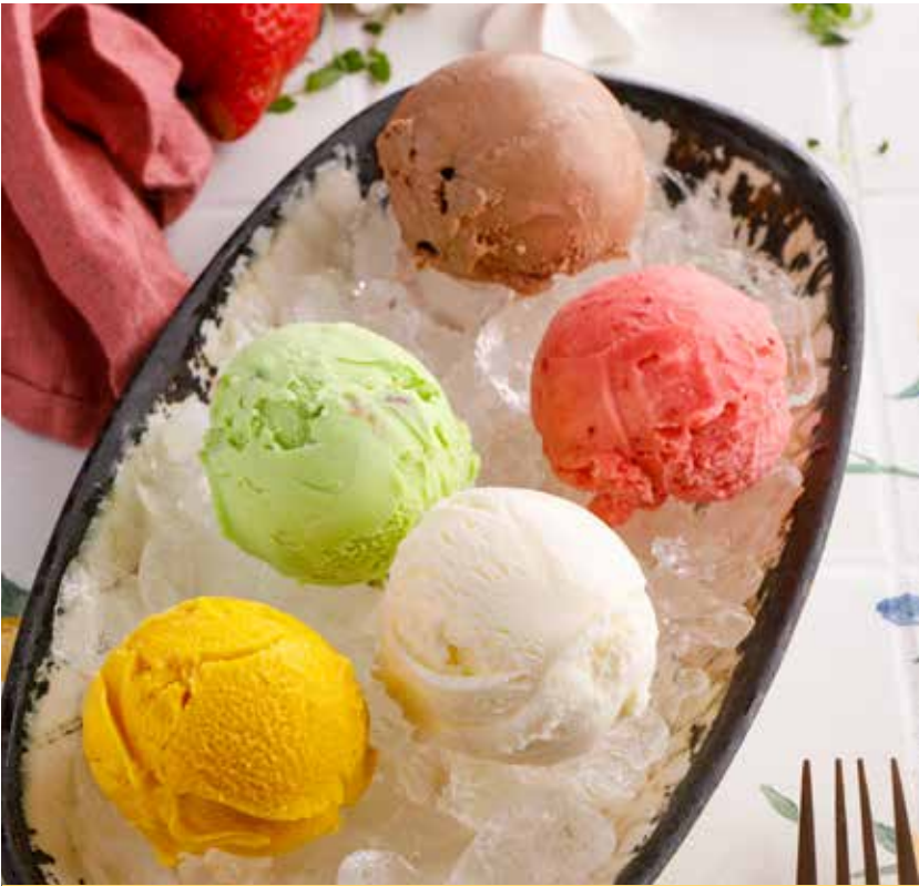
МОРОЖЕНОЕ / СОРБЕТ в ассортименте 250 Р Assorted ice cream / sorbet 什锦冰淇淋 / 什锦雪葩