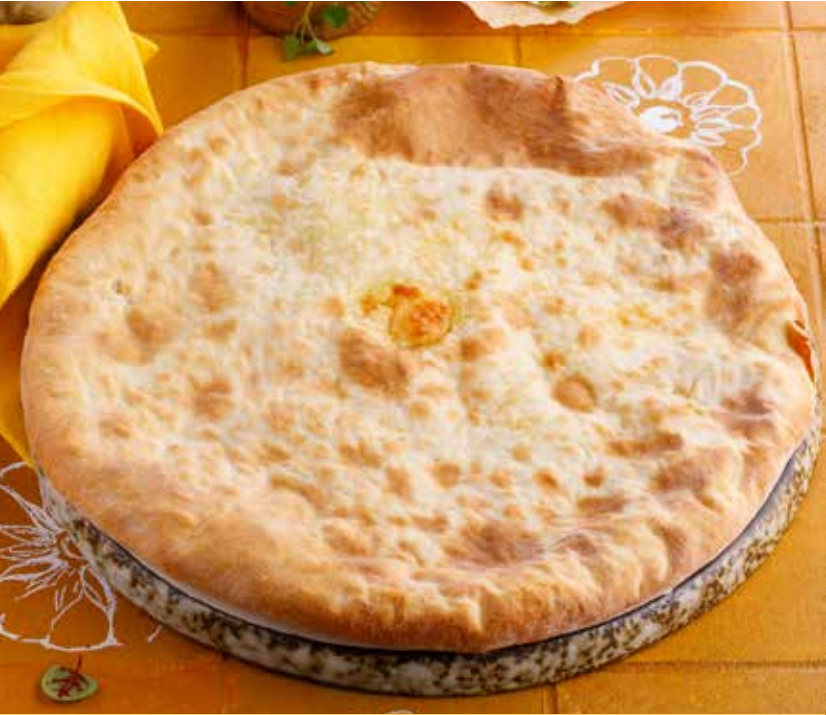
ХАЧАПУРИ ПО-ИМЕРЕТИНСКИ 750Р Imeretian style khachapuri | 伊梅列季亚卡查普里