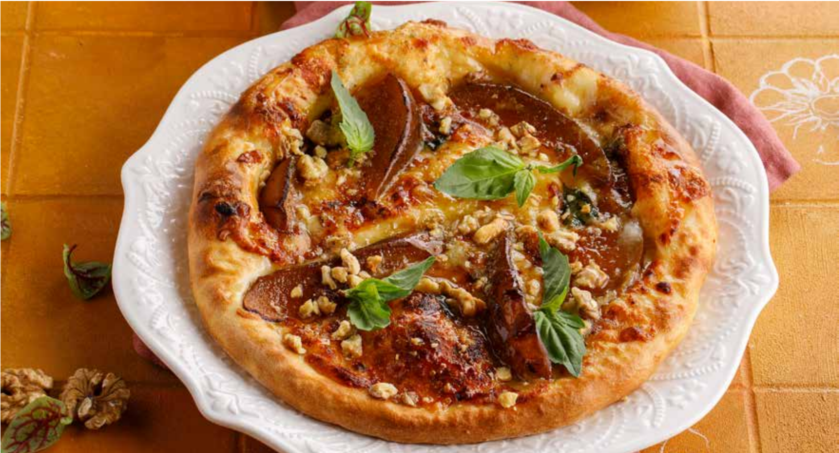
ХАЧАПУРИ С ГРУШЕЙ И СЫРОМ ГОРГОНЗОЛА 790Р Khachapuri with pear and gorgonzola cheese | 古冈左拉奶酪梨肉馅卡查普里