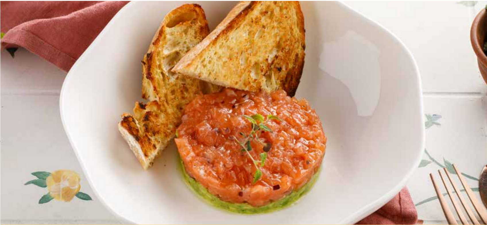
ТАРТАР ИЗ ЛОСОСЯ1490 Р Salmon tartare | 三文鱼塔塔