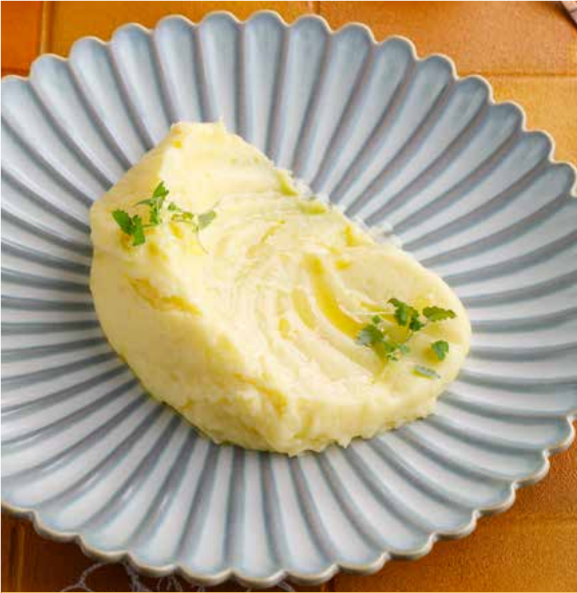
КАРТОФЕЛЬНОЕ ПЮРЕ Mashed potatoes | 土豆泥 350₽