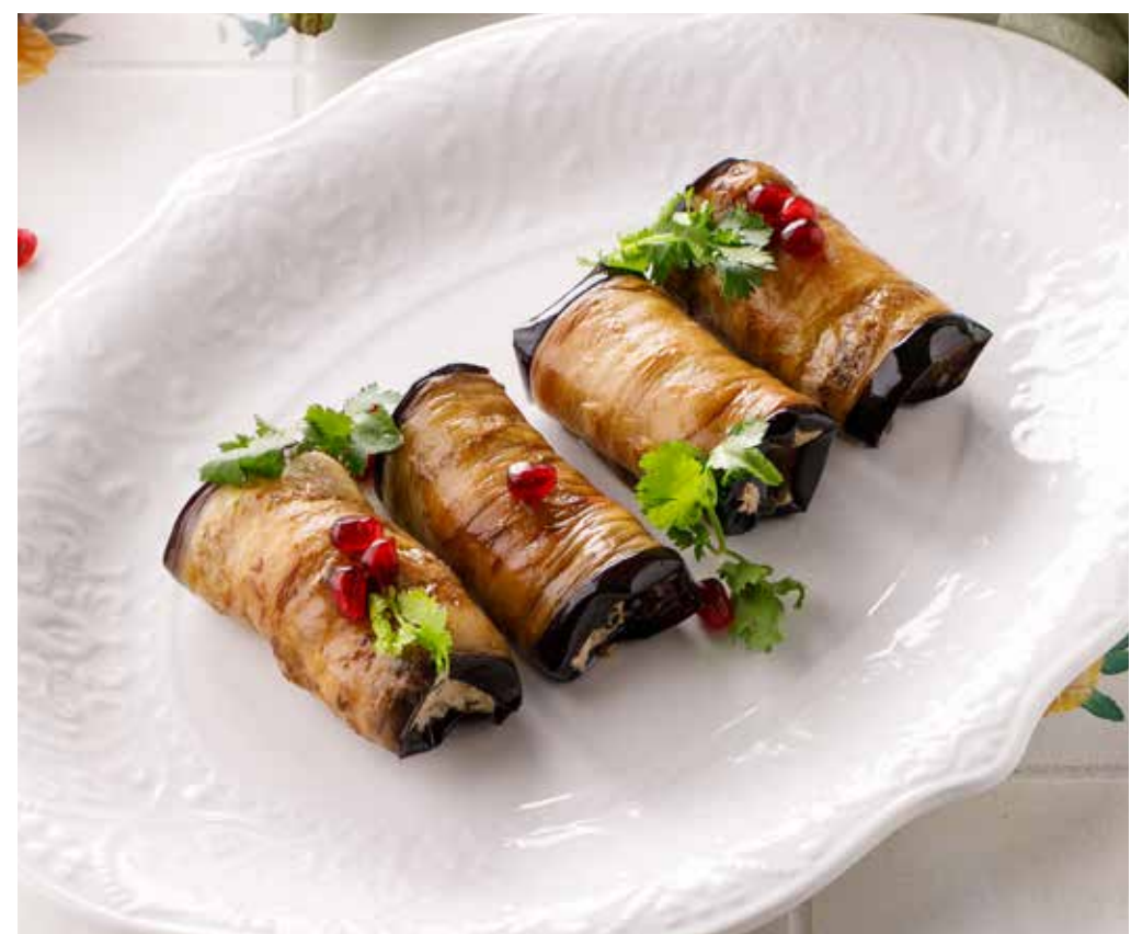
РУЛЕТКИ ИЗ БАКЛАЖАНОВ ПО-ГРУЗИНСКИ 690₽ Georgian style eggplant rolls | 格鲁吉亚式茄子卷