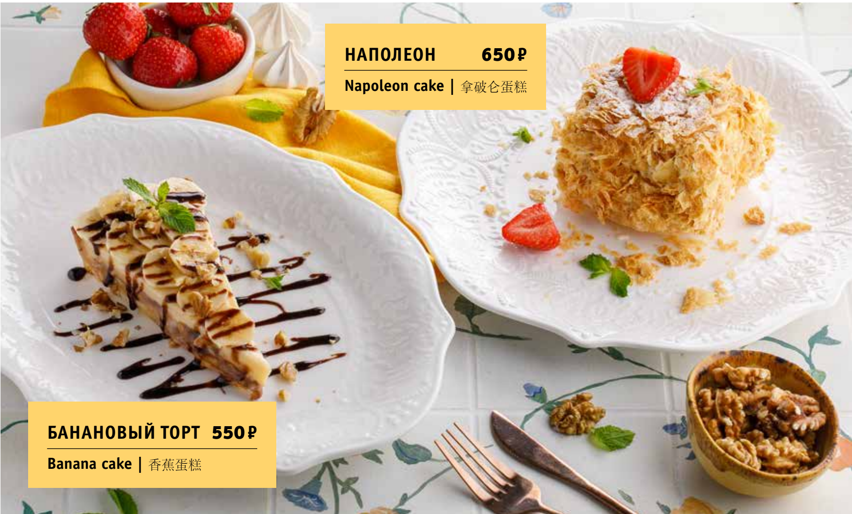
НАПОЛЕОН 650 Р Napoleon cake | 拿破仑蛋糕