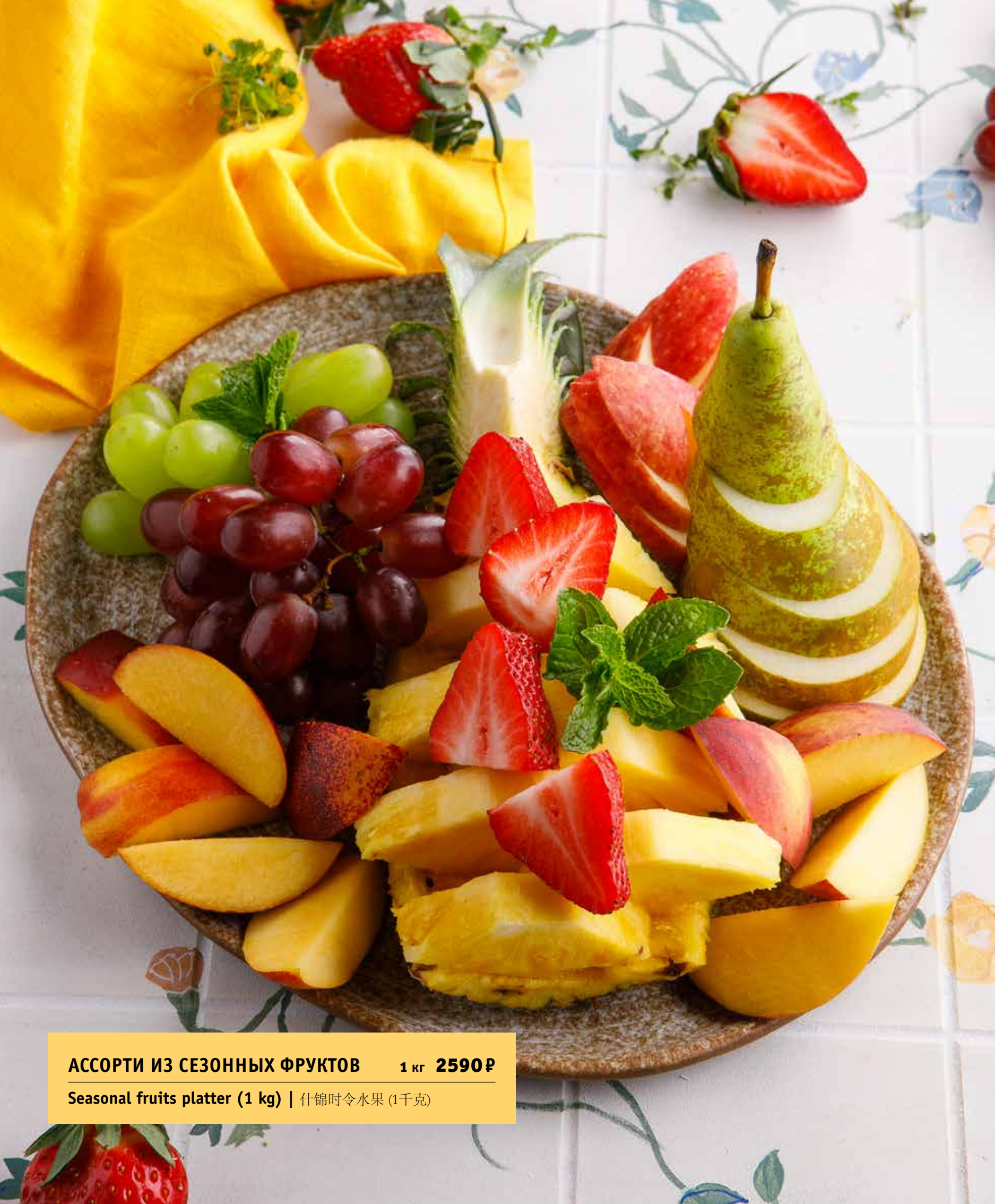
АССОРТИ ИЗ СЕЗОННЫХ ФРУКТОВ 1 кг 2590 Р Seasonal fruits platter (1 kg) | 什锦时令水果 (1千克)