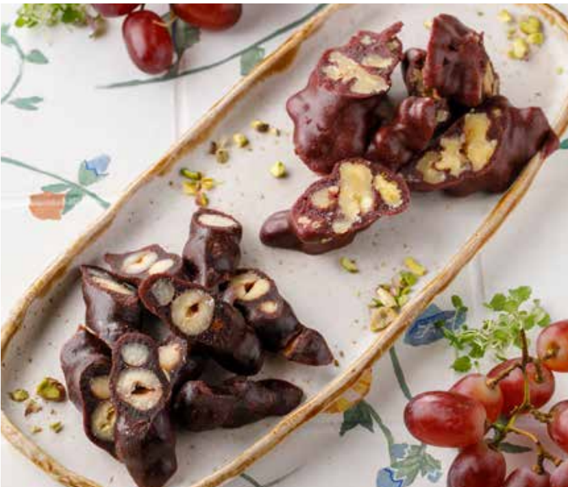
ЧУРЧХЕЛА С ГРЕЦКИМ ОРЕХОМ / С ФУНДУКОМ 490 Р Churchkhela with walnut / with hazelnut 格鲁吉亚核桃棒糖 / 格鲁吉亚榛果棒糖