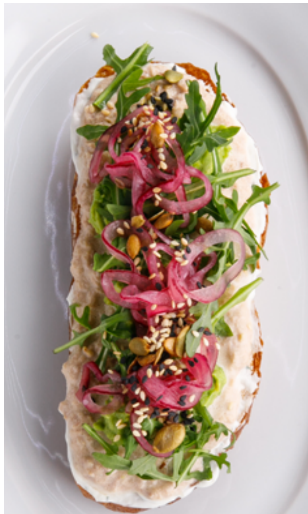
Тост с риемом из тунца с гуакамоле и красным луком Tuna rillettes toast with guacamole and red onion