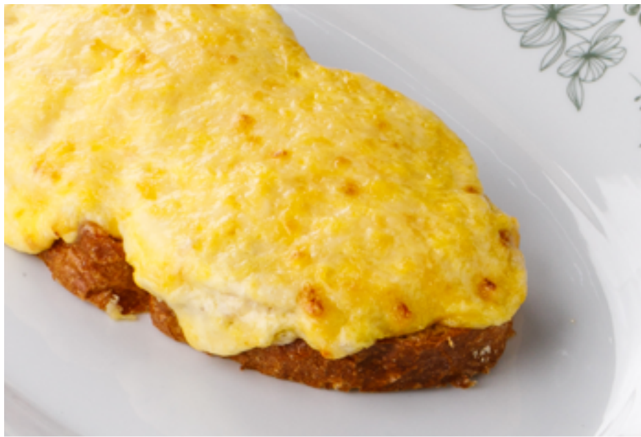
Домашний горячий бутерброд с колбасой и сыром Homemade hot sandwich with sausage and cheese