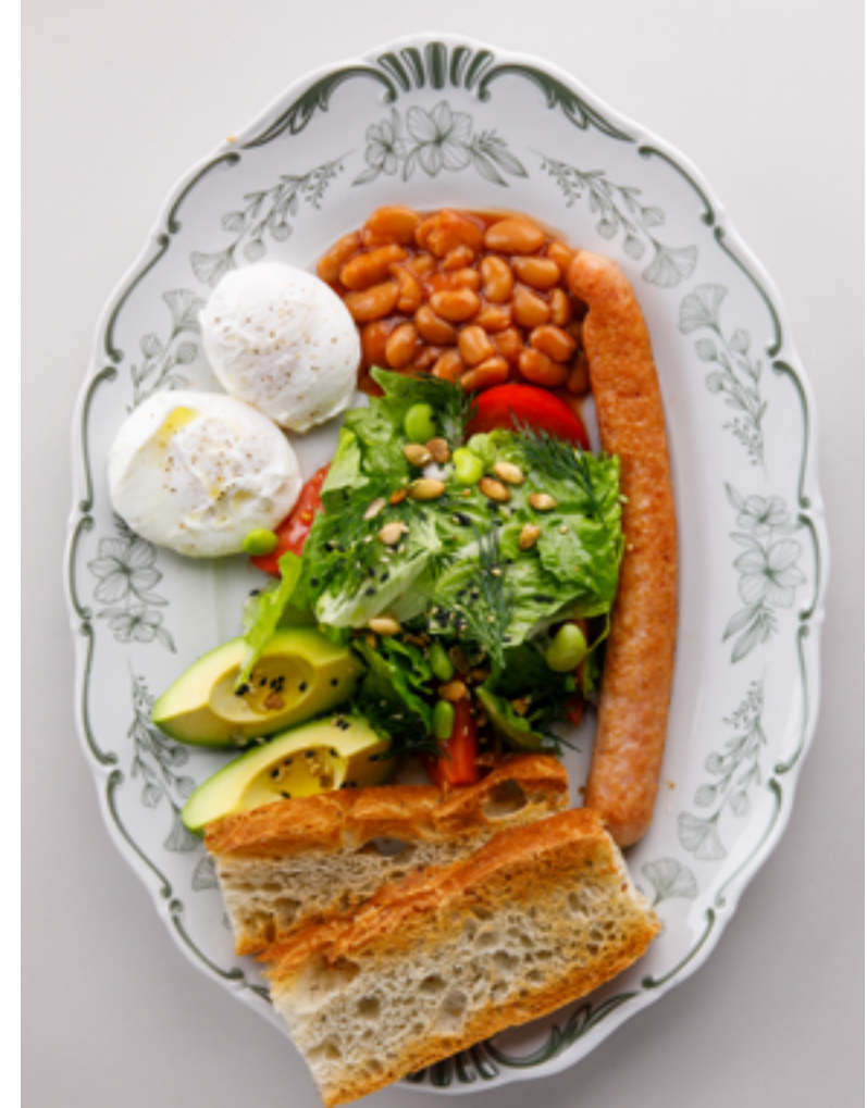
Завтрак от шефа 1390 Chef's breakfast