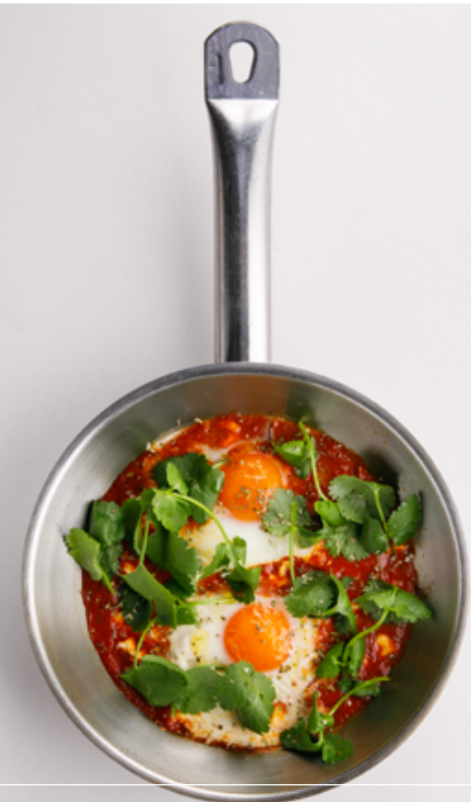
Шакшука с сыром фета 890 Shakshuka with feta cheese