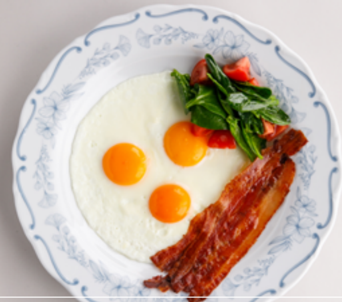
Глазунья с хрустящим беконом, свежими томатами и шпинатом 890 Sunny-side up eggs with crispy bacon, fresh tomatoes and spinach

Если у вас имеется аллергия на какие-либо продукты, пожалуйста, сообщите об этом официанту. If you are allergic to any foods, please tell the waiter.