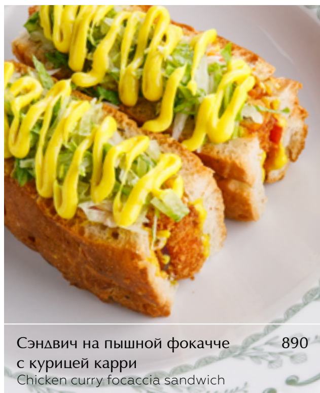
Сэндвич на пышной фокачче с курицей карри Chicken curry focaccia sandwich