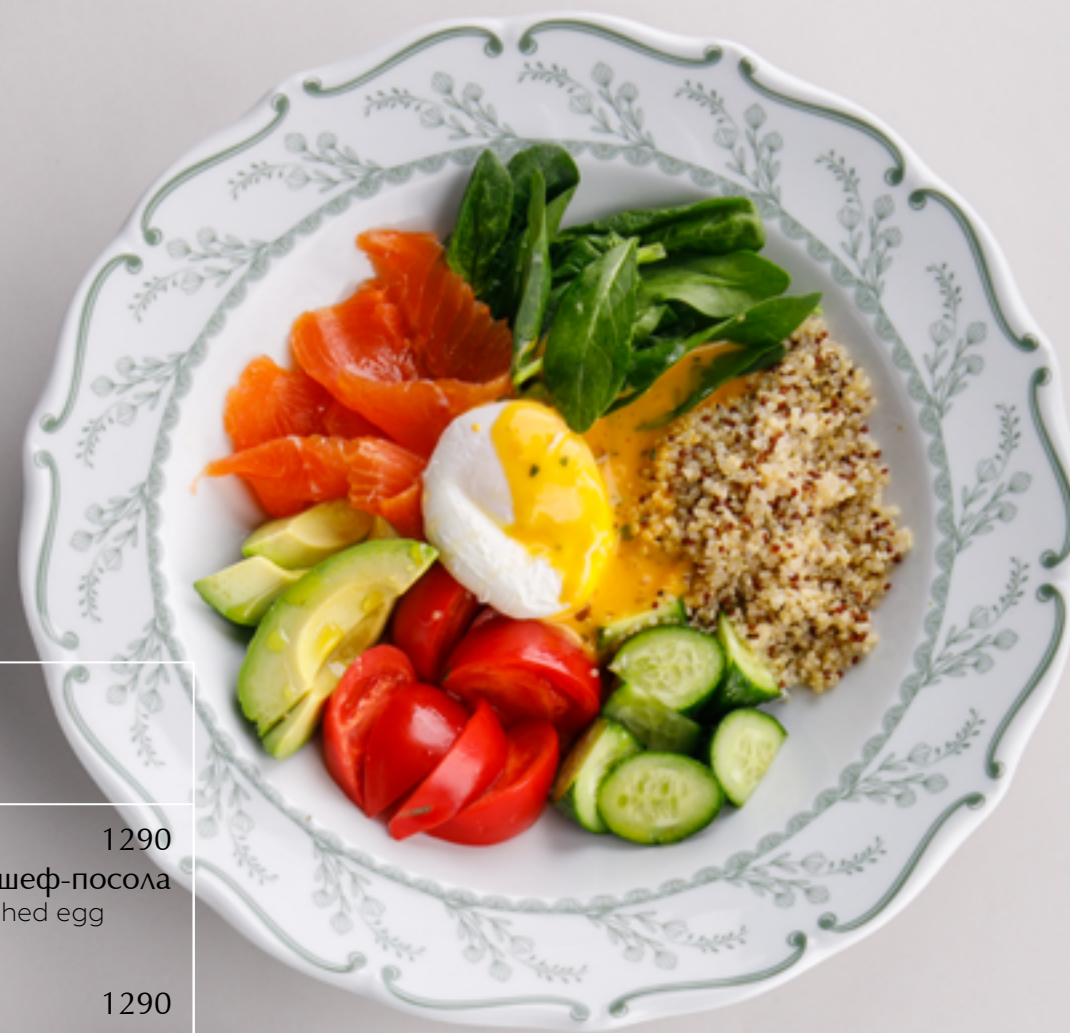
Зеленая греча с авокадо и яйцом пашот Green buckwheat with avocado and poached egg