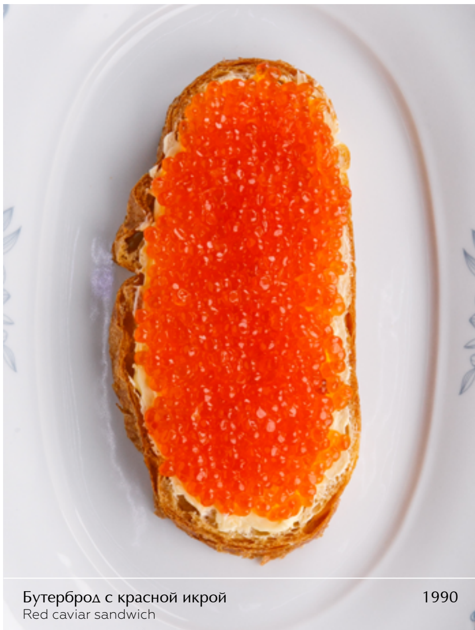
Бутерброд с красной икрой Red caviar sandwich