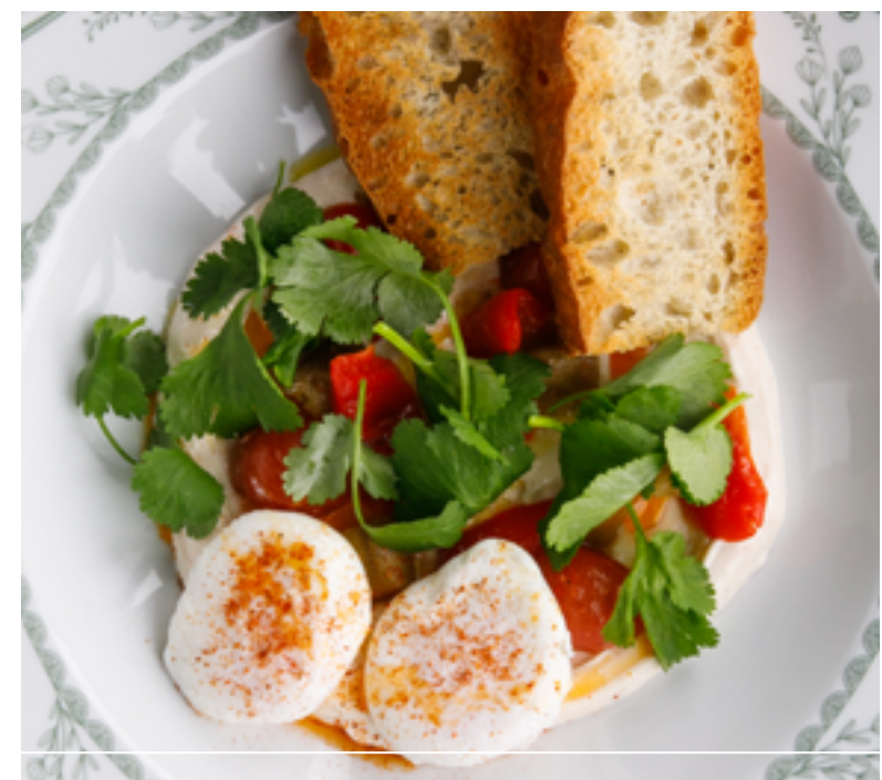
Яйцо по-турецки с печеными овощами 890 Turkish eggs with baked vegetables