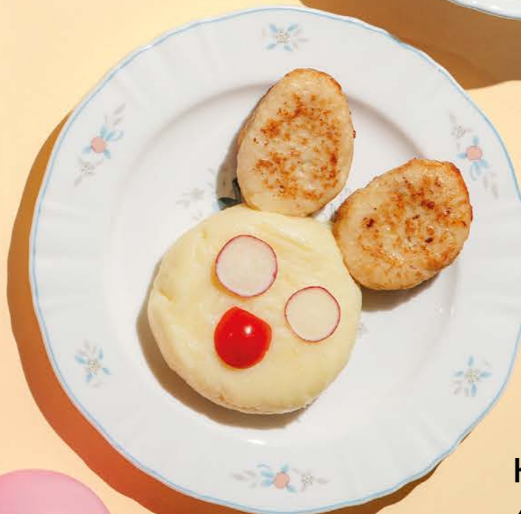
Котлеты из рыбы 450