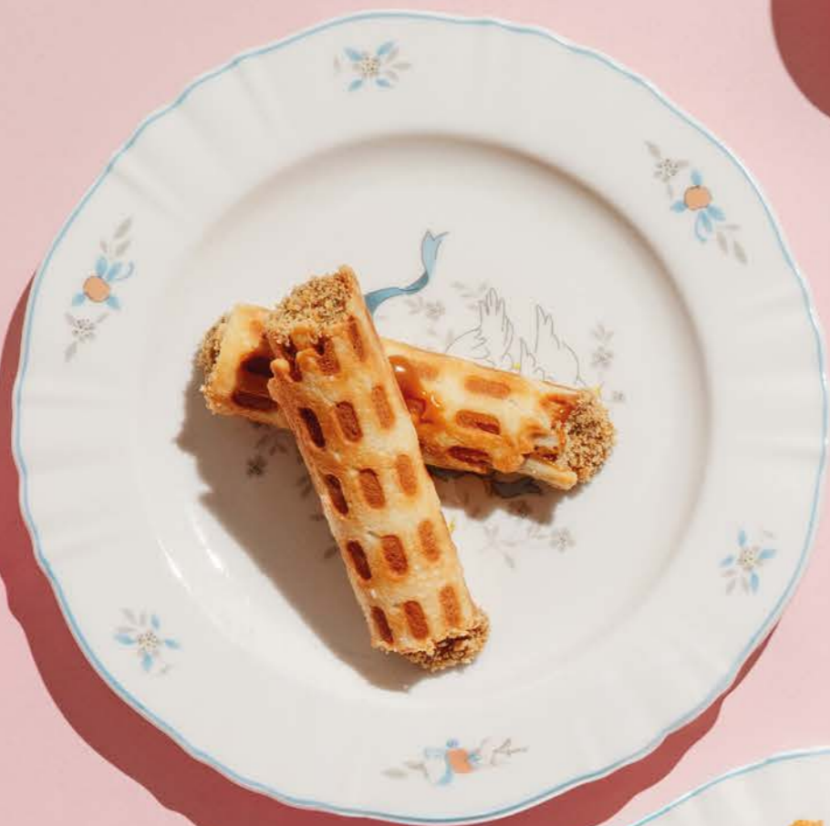
Сладкая трубочка 290