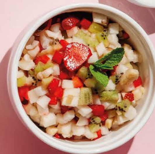
Фруктовый салат 390