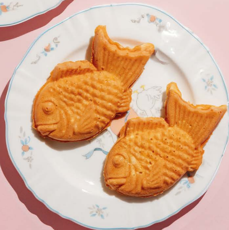
Рыбка 390 с заварным кремом, 1 шт