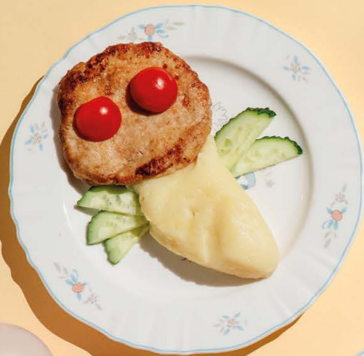
Котлета куриная 390