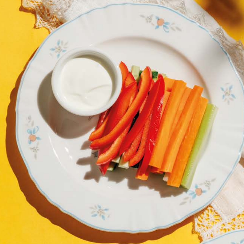
Овощные палочки 350