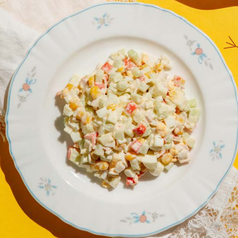
Кукурузный с крабовыми палочками 350